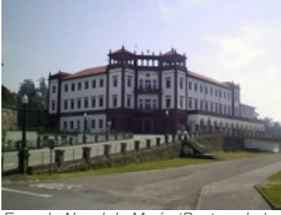
Escuela Naval de Marín (Pontevedra)

Claro que estas cosas sólo se entienden bien desde una visión trascendente de la vida. Por eso, cuando me correspondió decir unas palabras en los Actos de las Bodas de Oro de nuestro ingreso en la Escuela Naval Militar de Marín, les hablé a los alumnos y compañeros de promoción de mis vivencias en los años allí transcurridos, y entre otras, cosas, de los ratos que había pasado rezando en la capilla. No sé si fue algo adecuado para un acto de ese tipo, pero me pareció importante contarles mi experiencia, porque a mí, esos ratos personales de oración durante mi juventud me han dejado una huella indeleble.