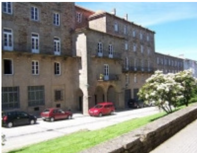
Colegio Mayor La Estila en la actualidad