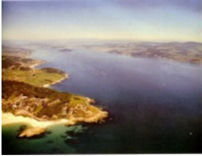
Vista aérea de la Ría de Pontevedra

En la capilla de la Escuela Naval, que estaba siempre abierta, me acercaba cuando podía para hacer un rato de oración junto al Santísimo. Era una capilla pequeña, situada en un lugar precioso, con una vista espléndida de la ría de Pontevedra.